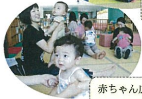
赤ちゃん広場 (0歳児対象) 諸富:第1(火)10:30~12:00