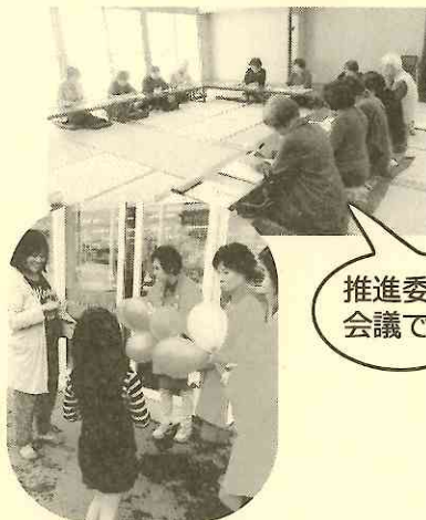
推進委員会会議です

・あいあいサロン（子育てサロン）への協力・赤い羽根街頭募金活動 ・地域での行事に参加協力