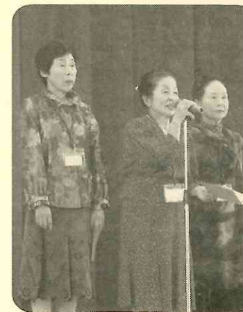
辻の皆さん「歌謡吟」