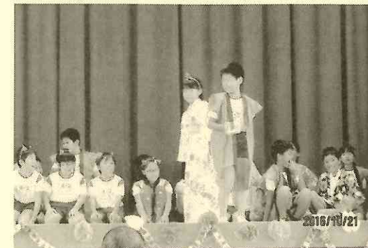
4-3 「三太郎と仲間たち」